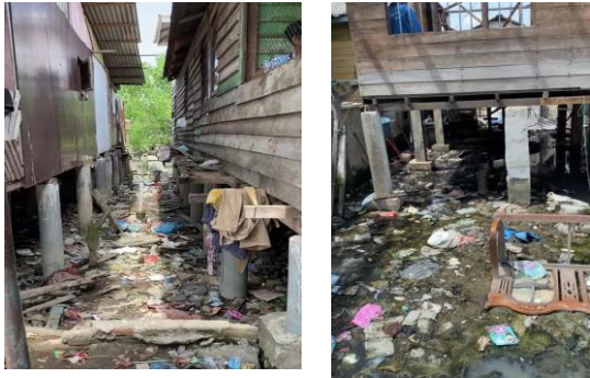
Gambar 2.1 Survey Lokasi Kelurahan Belawan Bahari

masyarakat dan akan dilengkapi dengan gambar-gambar, untuk dijadikan sebagai bukti dengan kejadian yang sebenarnya.