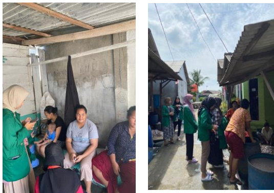
Gambar 2.2 Wawancarai Ibu Balita di Kelurahan Belawan Bahari

2. Metode penyuluhan dan membagikan poster, kegiatan penyuluhan yang dilakukan pada masyarakat (khususnya ibu balita) di Lingkungan VI dan VIII Kelurahan Belawan Bahari Kecamatan Medan Belawan. Dengan materi penyuluhan mengenai menjaga