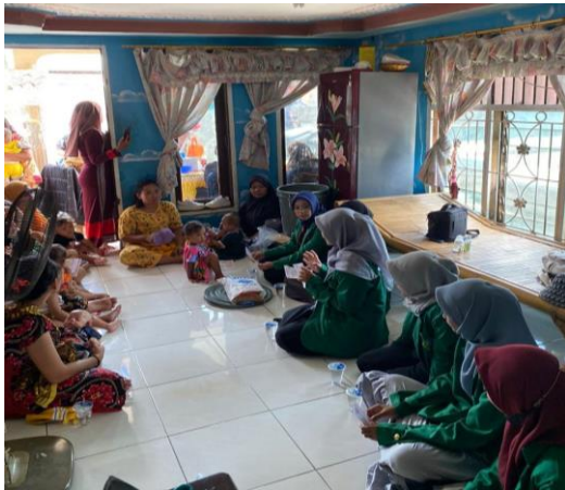
Gambar 2.4 Sesi Tanya Jawab di Kelurahan Belawan Bahari

Kegiatan penyuluhan berlangsung diiringi dengan pembagian poster mengenai menjaga kebersihan lingkungan dan dampak membuang sampah sembarangan. Poster ini dibagikan kepada masyarakat (khususnya ibu balita) agar informasi yang disampaikan akan lebih dipahami.