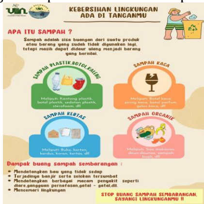
Gambar 2.5 Poster Penyuluhan Menjaga Kebersihan Lingkungan

Kegiatan penyuluhan berlangsung diiringi dengan pembagian poster mengenai menjaga kebersihan lingkungan dan dampak membuang sampah sembarangan. Poster ini dibagikan kepada masyarakat (khususnya ibu balita) agar informasi yang disampaikan akan lebih dipahami.