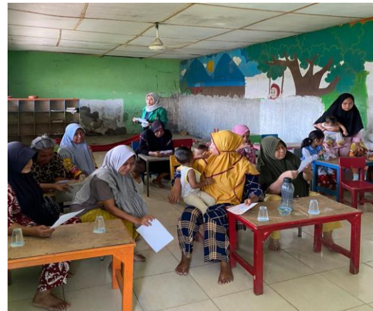
Gambar 2.3 Kegiatan Penyuluhan dan Membagikan Poster di Kelurahan Belawan Bahari

3. Metode tanya jawab, di dalam kegiatan penyuluhan ini dilakukannya tanya jawab untuk mengevaluasi pemahaman masyarakat (khususnya ibu balita) mengenai materi yang disampaikan dan untuk mendapatkan informasi-informasi lainnya mengenai