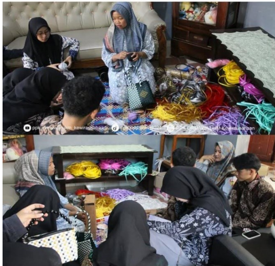
Gambar 3. Organizing