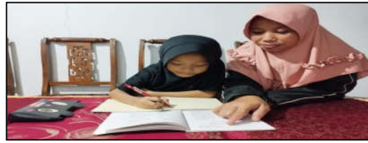
Gbr. 4 Orang Tua Menemani Siswa Belajar

Selain bertanggung jawab dalam biaya pendidikan, orang tua juga sangat berperan dalam mendukung proses pendidikan anak. Dukungan tersebut dapat berupa waktu yang diberikan untuk menemani anak dalam proses pendidikannya. Anak bertemu dan belajar bersama guru di sekolah hanya kurang lebih selama 5 jam saja dan lebih banyak menghabiskan waktu dirumah. Maka sudah seharusnya orang tua dapat meluangkan waktunya untuk menemani kegiatan belajar anak dirumah, sehingga anak akan lebih semangat untuk belajar.