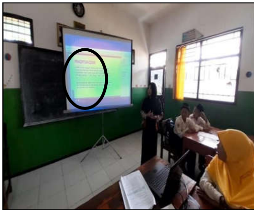
Gbr. 1 Kegiatan Pembelajaran di dalam Kelas

Pembelajaran di dalam kelas lebih banyak diterapkan pada mata pelajaran yang tidak banyak memerlukan praktik, misalnya pada mata pelajaran agama materi Qur'an Hadits. Pada kelas 4, 5, dan 6 materi yang disampaikan pada mata pelajaran Qur'an Hadits hanya berisi penjelasan teori yang mengharuskan siswa memahami dan menghafal, sehingga guru membutuhkan lebih banyak waktu di dalam kelas untuk menyampaikan materi.