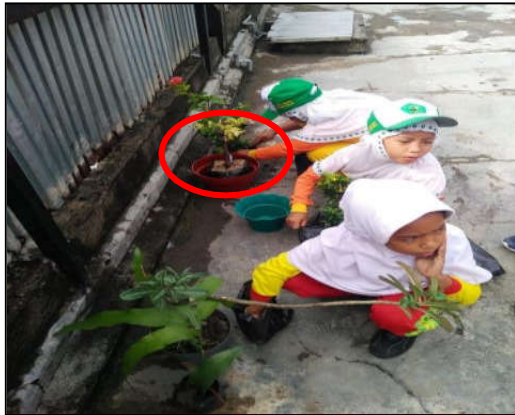
Gbr. 2 Kegiatan Pembelajaran di luar Kelas

Berdasarkan gambar diatas terlihat siswa semangat mengikuti kegiatan pembelajaran. Kegiatan belajar di luar kelas membuat siswa merasa bebas untuk melakukan apa yang telah mereka ketahui. Siswa akan mempraktikkan sesuatu yang telah telah disampaikan oleh guru ketika pembelajaran sebelumnya.