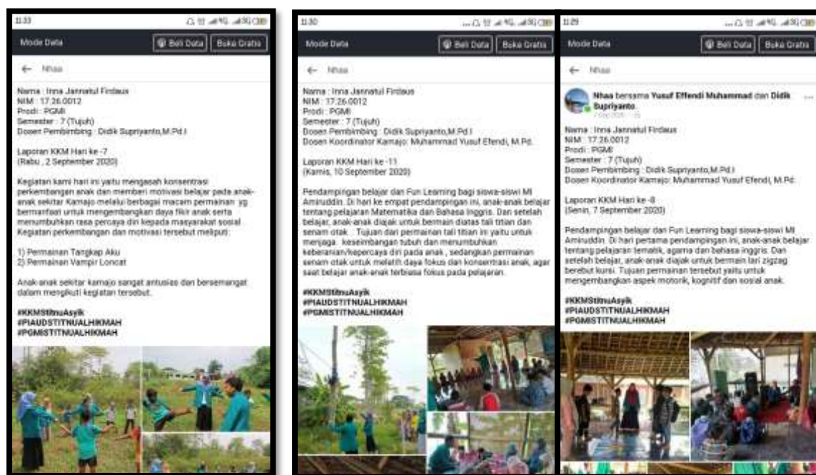
Gambar 2. Kegiatan Belajar Sambil Bermain

Gambar tersebut menunjukkan dimana TIM KKM melakukan strategi pembelajaran dengan media permainan tradisional dengan tujuan untuk meningkatkan motivasi belajar anak MI. Dengan begitu anak menjadi lebih merasa terapresiasi dan bersemangat dalam mengerjakan tugas-tugasnya. Kemudian, TIM KKM juga memberikan ucapan terima kasih kepada orangtua yang telah meluangkan waktunya mendampingi peserta didik dalam menyelesaikan tugasnya. Sehingga, orangtua juga merasa termotivasi untuk bersemangat dalam mendampingi anaknya belajar di rumah. Selain itu, tak lupa guru juga menyampaikan harapannya sebagai bentuk doa agar keadaan lekas membaik, sehingga anak-anak dapat belajar dan bermain bersama kembali di sekolah.