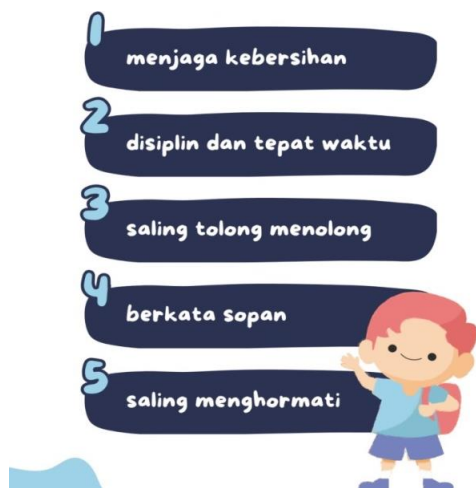
Gambar 1. Kesepakatan Kelas Disepakati Siswa dan Guru

Tahap terakhir yang dapat dilakukan adalah menyusun kalimat kesepakatan kelas. Guru mempersilahkan salah satu siswanya untuk memimpin diskusi. Pada langkah ini, seluruh masukan dari masing-masing siswa akan dikumpulkan dan kemudian didiskusikan. Berikut ini kesepakatan kelas yang sudah dibuat dan disetujui oleh semua siswa dan guru.