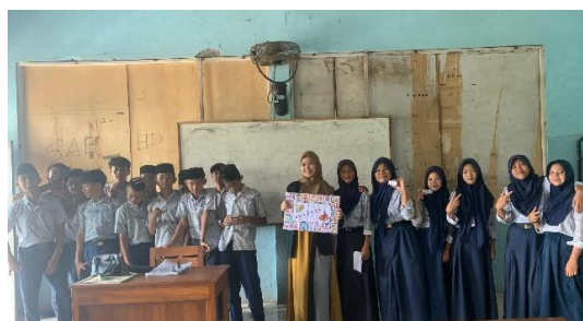
Gambar 4. Setelah implementasi kegiatan evaluasi menggunakan media monopoli Win or Challenge

Sebelum penerapan media Monopoli Win or Challenge , peserta didik MTs Darul Istiqomah menunjukkan antusiasme yang sangat rendah. Mereka sering kali tampak lesu dan kurang bersemangat dalam mengikuti sesi evaluasi, sehingga