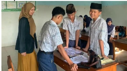
Gambar 3. Saat implementasi kegiatan evaluasi menggunakan media monopoli Win or Challenge

Challenge , evaluasi pembelajaran Fiqih menjadi kegiatan yang sangat dinantikan dan menciptakan pengalaman belajar yang lebih menyenangkan dan bermakna bagi seluruh peserta didik di MTs Darul Istiqomah.