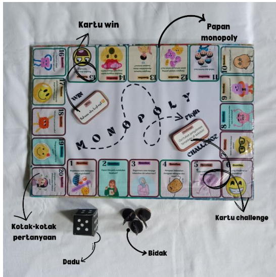
Gambar 2. Tampilan perbaikan desain setelah melaksanakan validasi oleh ahli media