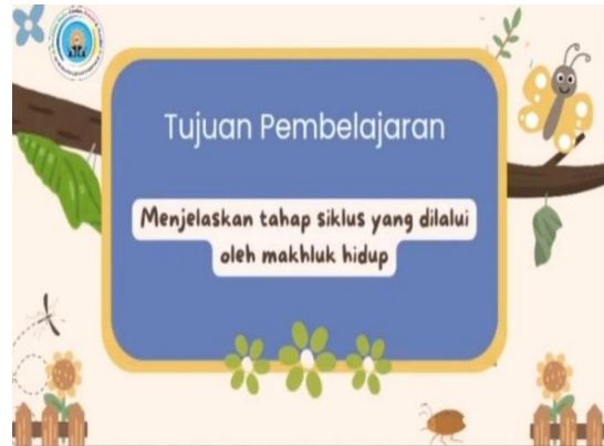
Gambar 2.2 Hasil pengembangan media pembelajaran berbasis digital video pembelajaran

pembelajaran antara lain; menyiapkan materi yang akan dijelaskan dalam video tersebut; mencari referensi video pembelajaran di youtube dengan mengamati, meniru dan memodifikasi supaya lebih berkembang; guru menggunakan canva dalam mengedit video pembelajaran dengan fitur-fitur yang sudah disediakan di aplikasi tersebut; setelah selesai, video pembelajaran diupload di youtube dan diimplementasikan di dalam pembelajaran kelas. Berikut tampilan hasil media pembelajaran berbasis digital video pembelajaran yang sudah dikembangkan oleh guru.