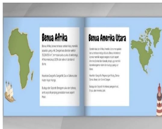
Gambar 2.3 Hasil pengembangan media pembelajaran berbasis digital e-book

pembelajaran menjadi lebih jelas dan terarah, serta e-modul ini lebih menarik karena dapat dilengkapi dengan fasilitas multimedia seperti gambar, animasi, audio, dan video melalui scan barcode. Hal ini relevan dengan pendapat Hidayati, dkk (2022) E-modul memiliki kelebihan dibandingkan dengan modul cetak karena sifatnya yang interaktif memudahkan dalam navigasi, memungkinkan menampilkan atau memuat gambar, audio, video, dan animasi serta dilengkapi tes atau kuis formatif yang memungkinkan umpan balik otomatis dengan segera (Hidayati Azkiya et al., 2022). Cara guru SD Muhammadiyah 2 Sidoarjo mengembangkan e-modul flipbook yaitu mencari dari referensi beberapa buku, terutama di buku di Kemendikbud, beberapa buku dari Airlangga, Yudistira dan membuat sesuai dengan CP dan TP yang ada di modul yang sudah diberikan oleh pemerintah. Selanjutnya guru mengembangkan flipbook di canva dengan fitur-fitur yang sudah disediakan dan desain sesuai dengan keinginan guru. Kemudian e-book di download dalam bentuk pdf. Setelah itu guru dapat memasukkan file ke aplikasi Anyflip atau bisa mengakses di web https://www.fliphtml5.com . Dengan langkah-langkah diatas flipbook dapat diimplementasikan ke siswa. Berikut contoh hasil e-book flipbook yang sudah dikembangkan guru.