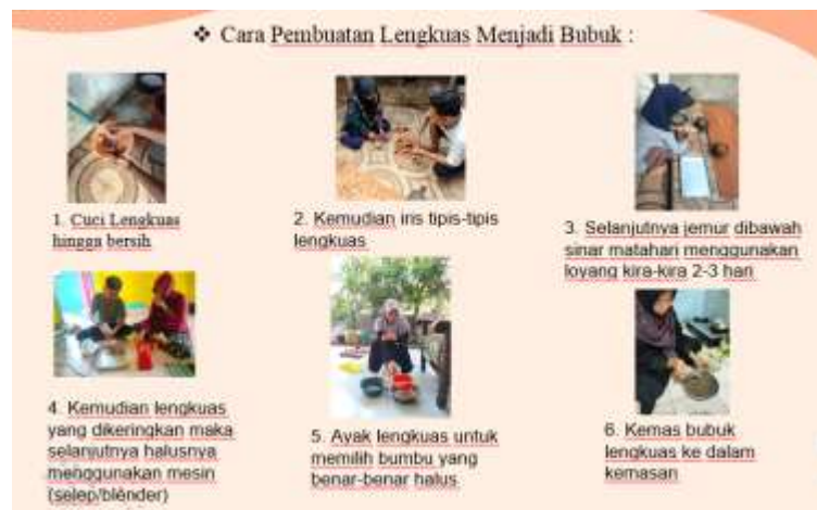
Gambar 1. Proses Pembuatan Lengkuas Bubuk

Kegiatan di mulai dengan diskusi untuk menentukan susunan jadwal program kerja yang akan dilakukan. Kemudian dilanjutkan dengan survey lokasi lahan tanaman lengkuas serta dilanjutkan dengan berkordinasi dengan para petani tempat lahan tersebut dan kepala desa Pagerjo Setelah itu dilanjutkan dengan pengambilan sampel lengkuas yang boleh dipanen untuk dijadikan produk. Setelah pengambilan sampel lengkuas, kegiatan dilanjutkan dengan membersihkan lengkuas dan mempersiapkan bahan dan alat yang akan di gunakan untuk mengolah lengkuas tersebut. Kemudian di lanjutkan dengan mengiris tipis-tipis lengkuas, lalu dikeringkan selama 2 hari dan diblender untuk dijadikan bubuk lengkuas.