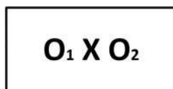
Gambar 1. Desain Penelitian

Metode penelitian yang digunakan adalah kuantitatif eksperimental. Penelitian eksperimen bertujuan mengetahui kebenaran pengaruh variabel antara X dan Y. Penelitian eksperimental didefinisikan sebagai model penelitian yang memberikan stimulus atau perlakuan dan kemudian mengamati efek atau efeknya. (Kasiram dalam Rahmi, 2021) Desain penelitian dalam penelitian ini adalah one group pre-test post-test design . Desain ini menggunakan uji pretest yang diberikan sebelum perlakuan dan uji posttest yang diberikan setelah perlakuan. Sehingga dapat diperoleh gambaran hasil penelitian yang tepat karena adanya perbandingan hasil antara sebelum dan sesudah perlakuan (Sugiyono, ). Adapun desain penelitian one group pretest- posttest design adalah sebagai berikut: