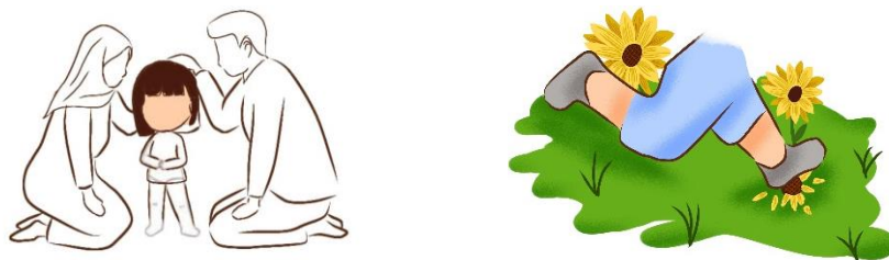
Gambar 1. Tahap ilustrasi buku cerita bergambar

Pada tahap pengembangan, peneliti bekerjasama dengan ilustrator dan penata letak untuk menerjemahkan rancangan buku ( story board ) yang sudah didesain pada tahap sebelumnya.