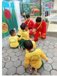
Gambar 1. Peserta melakukan persiapan sebelum latihan

Materi yang disampaikan yaitu materi mengenai keislaman dan gerkan silat atau jurus. Materi keislaman mengingatkan kita bahwa kita adalah makhluk ciptaan Allah.