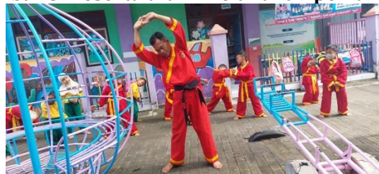
Gambar 3. Peserta didik melakukan pemanasan

Ekstrakurikuler seni bela diri pencak silat ini berhubungan dengan latihan gerakan jurus. Keterampilan jurus yang dimiliki anak-anak dapat dilihat dari kemampuan jurus yang dikuasai. Siswa yang memahami materi dengan baik dan memiliki jurus yang dikuasai memiliki tingkat percaya diri saat praktik tampil di depan teman-temannya dan saat tampil di acara kegiatan Peringatan Isra Mi'raj di Alun-alun Merdeka Ngawi.