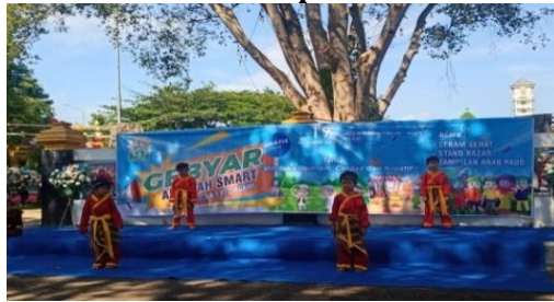
Gambar 7. Peserta didik tampil dalam acara isro' mi'roj

Di bawah ini adalah data dari hasil penelitian terkait tingkat percaya diri anak sesudah melaksanakan ekstrakurikuler tapak suci pada bulan November 2023 sampai februari 2024: