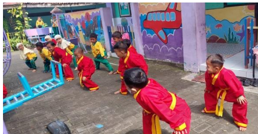
Gambar 6. Kegiatan ekstrakurikuler di akhiri dengan penutupan