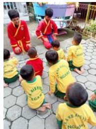
Gambar 2. Peserta menerima materi keislaman

Sebelum melakukan gerakan dasar, peserta didik di beri materi pemanasan. Pemanasan berguna untuk merileksasikan otot saat latihan supaya meminimalisir terjadinya cidera atau kram otot. Menurut pelatih anak yang belum memiliki percaya diri terlihat malu-malu atau takut saat masih melakukan pemanasan.