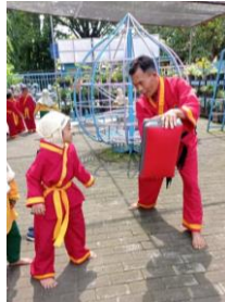
Gambar 4. Peserta didik menerima materi gerakan dasar

Latihan dilakukan pada hari jum'at jam 09.00-10.00 Wib. Rangkaian kegiatan meliputi: pembukaan, pemberian materi dan penutup. berikut waktu proses ekstrakurikuler tapak suci.