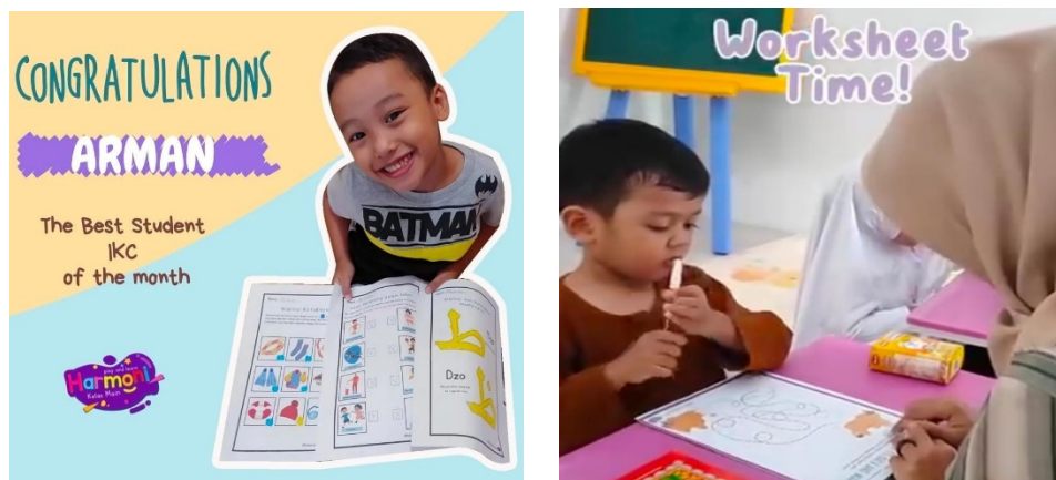
Gambar 2. Kegiatan time worksheet di rumah

Karena peran orangtua dalam pembelajaran aktif untuk anak usia dini ini adalah sebagai jembatan orangtua dan guru. Dengan berkomunikasi secara terbuka, orang tua dapat berbagi informasi tentang perkembangan anak dan membantu guru memahami kebutuhan serta tantangan yang dihadapi anak di rumah dan sekolah. Selain itu orang tua juga berfungsi sebagai model peran bagi anak-anak mereka. Ketika orang tua aktif terlibat dalam pendidikan anak-anak mereka, proses pembelajaran menjadi lebih berarti dan bermakna (Putri et al., 2023). Orangtua dapat menunjukkan sikap positif terhadap pendidikan dan pembelajaran, orang tua dapat menginspirasi anak untuk menghargai pentingnya pendidikan. Ketika orangtua berperan aktif dalam mendampingi kegiatan belajar di rumah, hal ini tidak hanya memperkuat pemahaman anak akan tetapi juga menunjukkan bahwa orangtua peduli terhadap pendidikan anak.