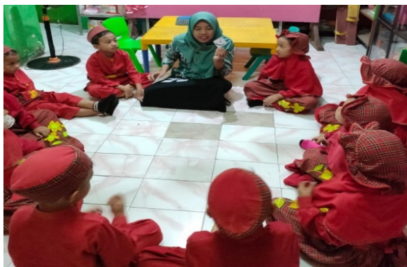
Gambar 4.2 guru sedang menerangkan kartu huruf hijaiyah berwarna

kartu huruf hijaiyah berwarna dengan warna merah berada di letakkan di sebelah huruf pertama dan dibaca kedua, sedangkan kartu dengan warna biru diletakkan sebelah kanan setelah dua huruf yang ditunjukkan tadi dan dibaca ketiga. Anak diharapkan mampu membaca tiga huruf Al-Qur'an secara tepat.