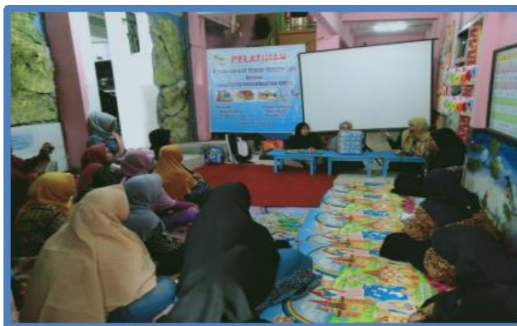
Gambar 2. Penyajian Materi oleh Narasumber

Penyajian materi oleh narasumber pukul 09.00-09.30, yaitu materi tentang APE meliputi pengertian, tujuan dan manfaat APE menggunakan metode ceramah, kemudian dilanjutkan dengan membuka sesi tanya jawab selama 30 menit.