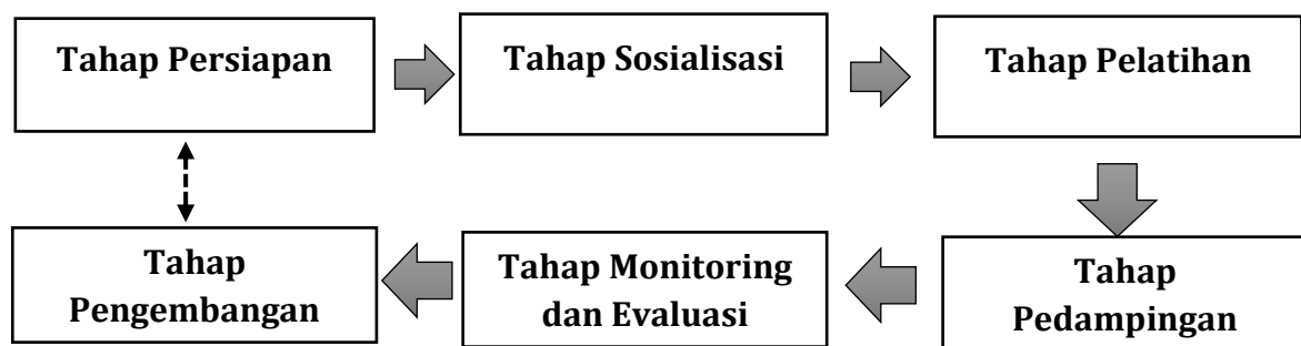
Gambar 1. Alur Pelaksanaan Pelatihan Pembuatan Alat Permainan Edukasi AUD

pada Tahap Pengembangan dilakukan setelah pendampingan serta monitoring selesai. Dalam tahap pengembangan ini diharapkan lembaga mempunyai galeri alat permainan edukatif agar lembaga lain bisa termotivasi dalam pembuatan alat permainan edukatif (APE). Alur pada Metode Pelaksanaan pelatihan ini dapat dilihat pada gambar 1.1 sebagai berikut: