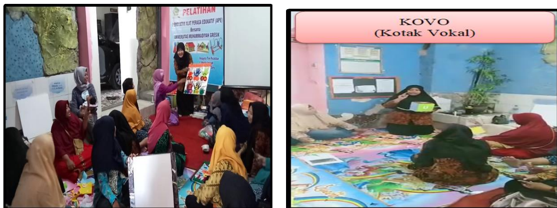
Gambar 5. Presentasi Hasil APE

Tepat pukul 13.00 WIB, masing-masing kelompok telah menyelesaikan pembuatan APE. Kemudian memberi kesempatan pada tiap kelompok untuk mempresentasikan hasil kreativitasnya dalam pembuatan APE dimana kelompok yang lain sebagai siswa.