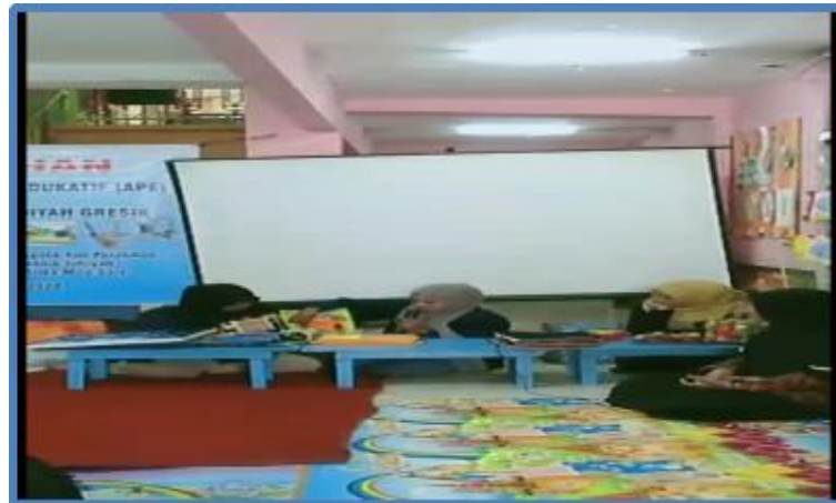
Gambar 3. Penyajian Contoh APE oleh Anggota Tim

Penyajian materi oleh narasumber berakhir pukul 10.00, kemudian dilanjutkan dengan pemberian contoh APE yang sudah jadi beserta panduan penggunaan alat permainan edukatif oleh tim pengabdian pukul 10.00 - 11.00.