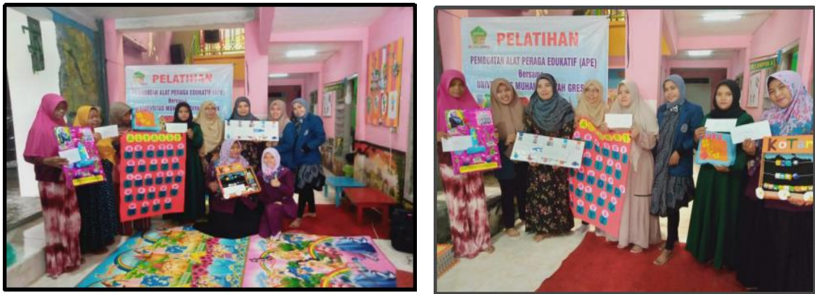
Gambar 6. | Penghargaan atas hasil APE yang telah dibuat

Hasil APE yang telah dibuat oleh dewan guru RA Team Cendekia, ditempatkan di ruang yang diberi nama galeri Alat Permainan Edukatif (APE)